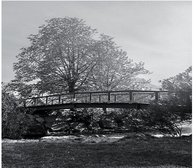
Paso de los toros (14-09-1920)