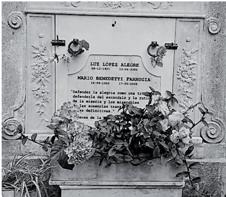
(Fotografía de la tumba de Mario Benedetti extraída del artículo del 16 de agosto de 2018 del periódico La Voz del Sur. Enlace: https://www.lavozdelsur.es/opinion/buscando-la-tumba-de-mario-benedetti_31701_102.html )